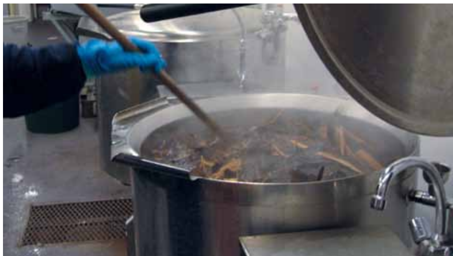
Pajuparkkia kiehumassa keittopadassa

Parkitseminen tapahtuu kädenlämpöisellä liemellä, ei koskaan yli +38°C. Parkkiintuminen kestää viikon tai jopa kaksi. Nahat siirretään aina uuteen parkkiliemeen, kaikkiaan liemiä tarvitaan jopa parikymmentä riippuen mm. liemessä olevien nahkojen määrästä. Nahan parkitustapa ja -aste valitaan nahan tulevan käyttötarkoituksen mukaan. Jos nahasta on tarkoitus ommella esim. kahvipusseja ja muita pieniä, pehmeää nahkaa vaativia tuotteita, täytyy nahka parkita läpi, kypsäksi. Seuraava ohje onkin nahkojen parkitsemiseksi kypsäksi asti