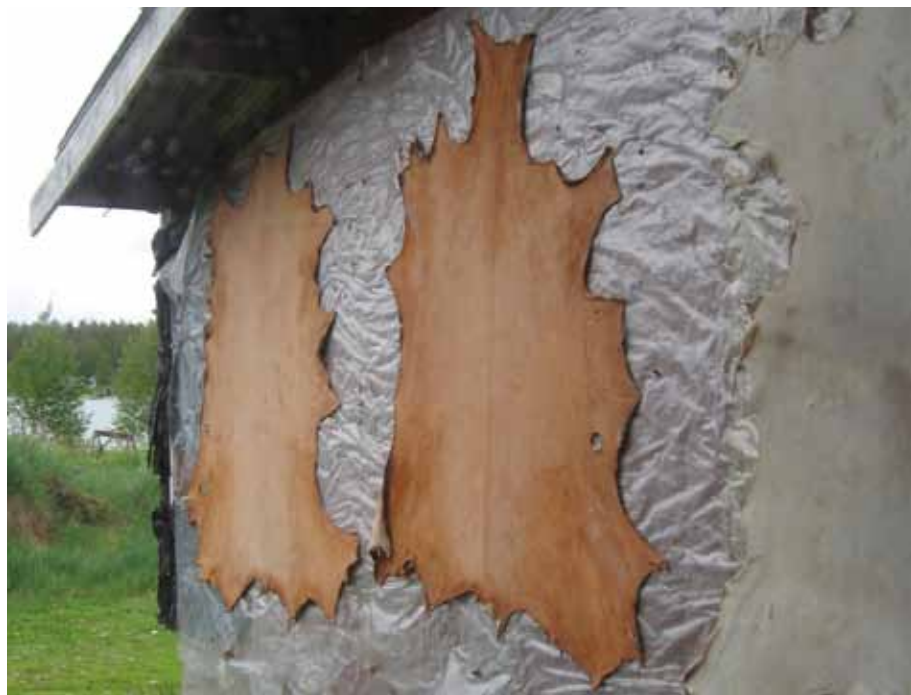
Parkitut sisnat kuivumassa. Jokkmokks Naturskinn.

siin ja pakastavat sen. Sisna otetaan sitten sopivalla aikaa sulamaan ja sulana sitä venytellään ja muokataan käsissä, jolloin se samalla sekä kuivuu että muokkautuu hiukan. Sisna voidaan pakastaa uudelleen ja toistaa työvaiheet, kunnes sisna on kuiva ja pehmeä. Nämä tavat ovat hitaita ja raskaita, ja sopivat silloin kun tehdään muutama sisna kerralla.