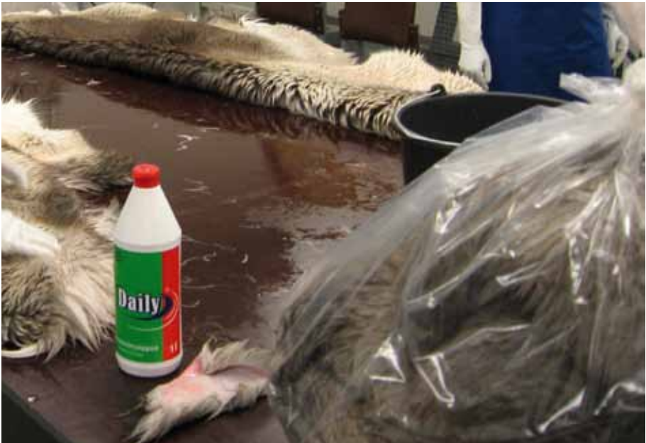
Taljat pakataan säkkeihin pesun jälkeen.

Tarkkaile taljan lämpötilaa nivotuksen aikana. Vaikka taljasäkki saa olla huoneenlämmössä, lattialämmitys voi olla nivotukseen liian tehokas. Taljan tulisi säilyä viileänä nivotuksen ajan. Kun peset taljaa, paina kätesi vasten nahkaa. Taljan