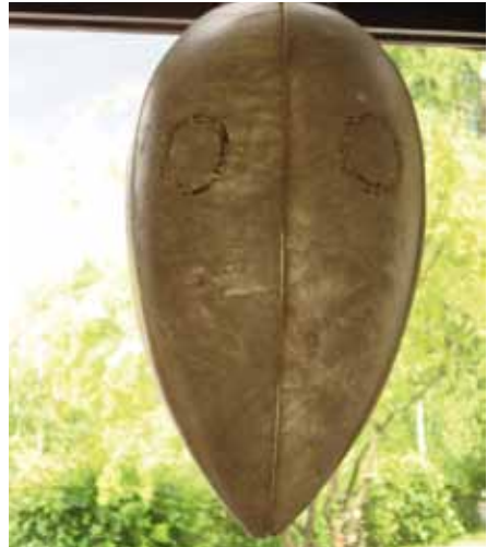
Lampunvarjostin, nahkaa. Bölebyns Garveri.