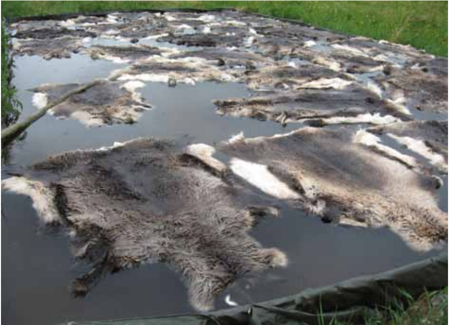
Nivotus altaassa. Jokkmokks Naturskinn.

Talja laitetaan lumeen marras-joulukuussa kesipuoli alaspäin, siten että taljan ja maan väliin jää lunta vähintään 10cm. Talja saa olla hangen alla koko talven, niin kauan kuin lunta riittää. Huolehdi että talja pysyy koko ajan lumen sisällä eikä pääse kuivumaan. Kevään suvikelien aikaan karvat irtoavat taljasta. Hangessa nivotettaessakin nahkaan voi tulla pilkkuja tai läikkiä homeesta tai tuhkasta.