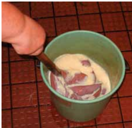
Sisnan rasvaus astiassa parkki-rasvaliemessä.

Jotta nahka imisi rasvan, anna sen kuivua kunnes se on kostea kuin kuivaksi puristettu pöytäluutu. Sekoita 1dl nahkarasvaa ja 1dl parkkilientä tai vettä. Levitä nahka pöydälle kesipuoli ylöspäin ja sivele rasva nahalle esim. maalipensselillä. Näin rasvaamalla jätteenä ei jää rasvalientä, eikä rasvaa joudu viemäriin kautta luontoon.