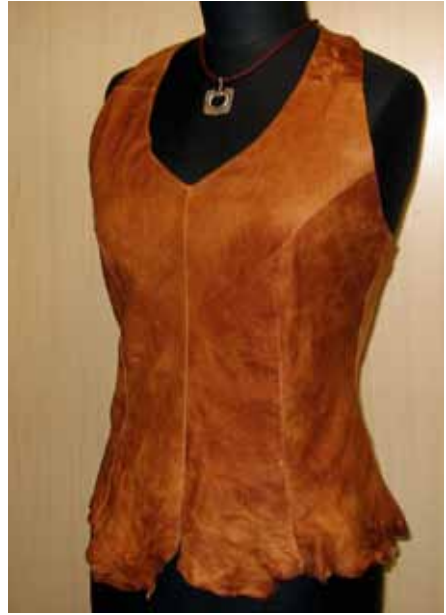
Toppi sisnanahkaa, Virpi Jääskö.