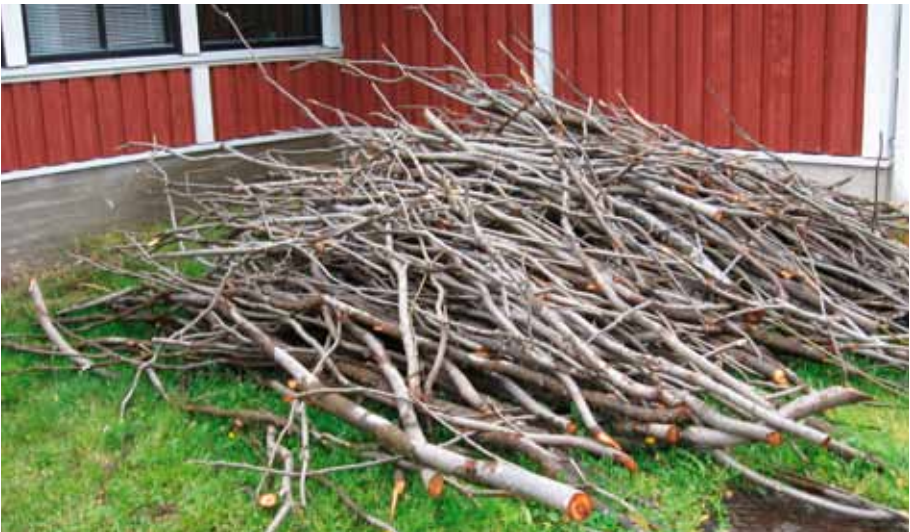
Kaadetut ja karsitut pajut odottavat kuorimista

Kun kuoret tuntuvat käteen kuivilta, ne voi varastoida kosteudelta suojattuna esim. paperisäkkeihin, sipulisäkkeihin