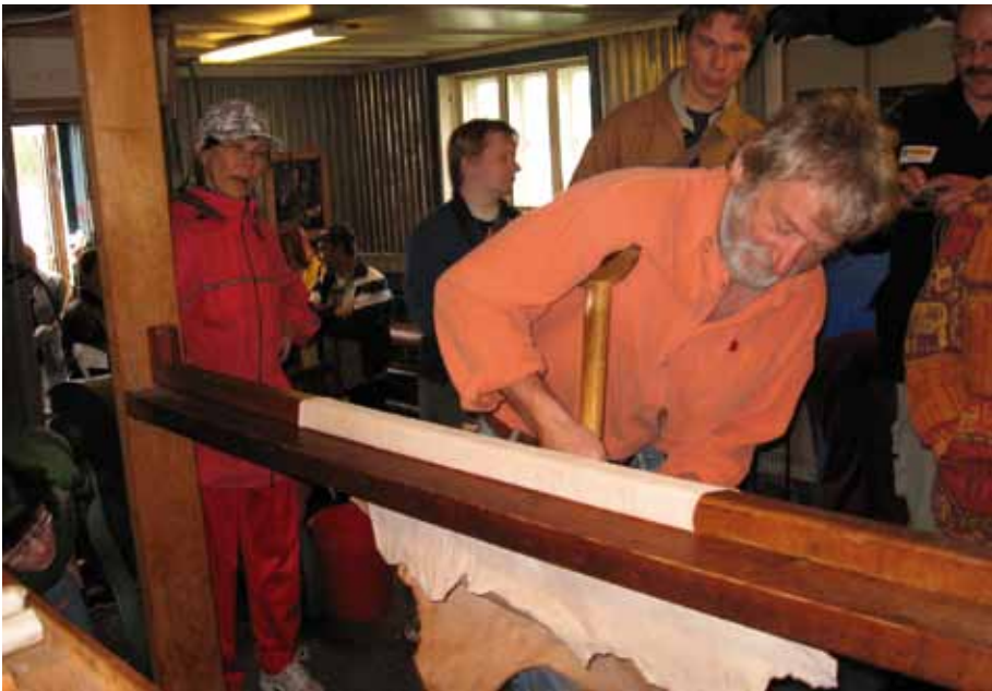
Kuivatun sisnan pehmitys. Jokkmokks Naturskinn

Nahkateollisuudessa käytetään monia erilaisia koneita venyttämään nahkaa. Sellaisia ei Toivoniemen nahkamuokkamossa ole toistaiseksi, joten venytämme nahat enemmän tai vähemmän käsityönä. Sisnoja voi venyttää käsin, jiekiöllä tai kaapimaraudalla, tai erityisesti pehmittämistä ja venytystä varten tehdyllä varrellisella raudalla, jonka terä ei ole leikkaavan terävä. Myös pehmityspuuta tai nahkurin penkkiä voi käyttää apuna.